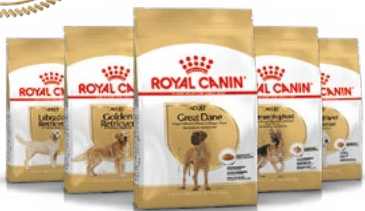
Dogue allemand adulte