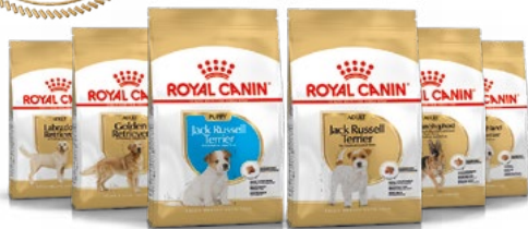
Jack Russell Terrier chiot