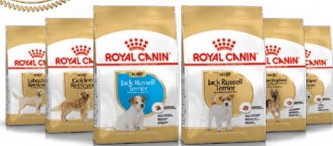
Jack Russell Terrier chiot