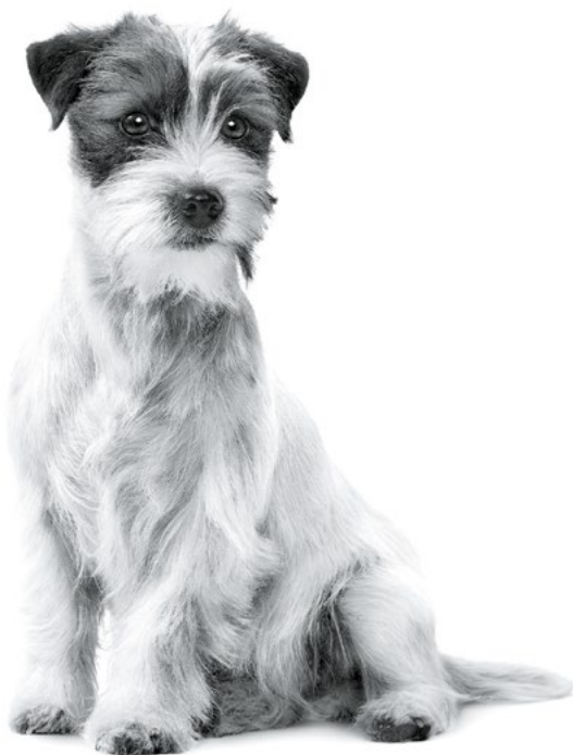
Jack Russell Terrier adulte

Pour plus d'informations, rendez-vous sur www.royalcanin.com ou prenez contact avec votre commercial Royal Canin .