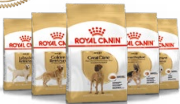
Dogue allemand adulte