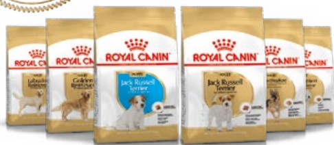
Jack Russell Terrier chiot