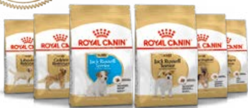
Jack Russell Terrier chiot