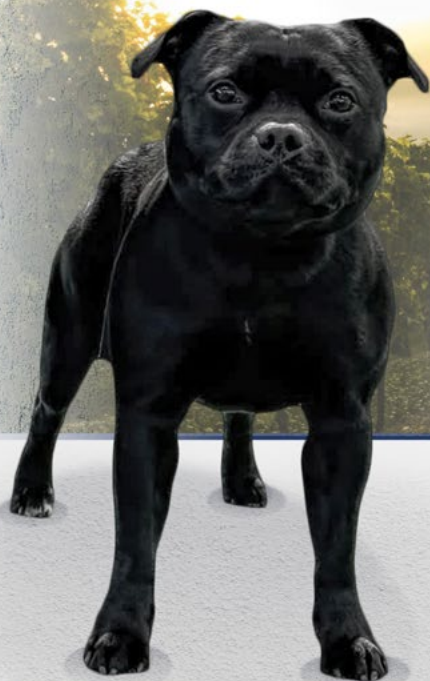
Elitebull Prospect "George"