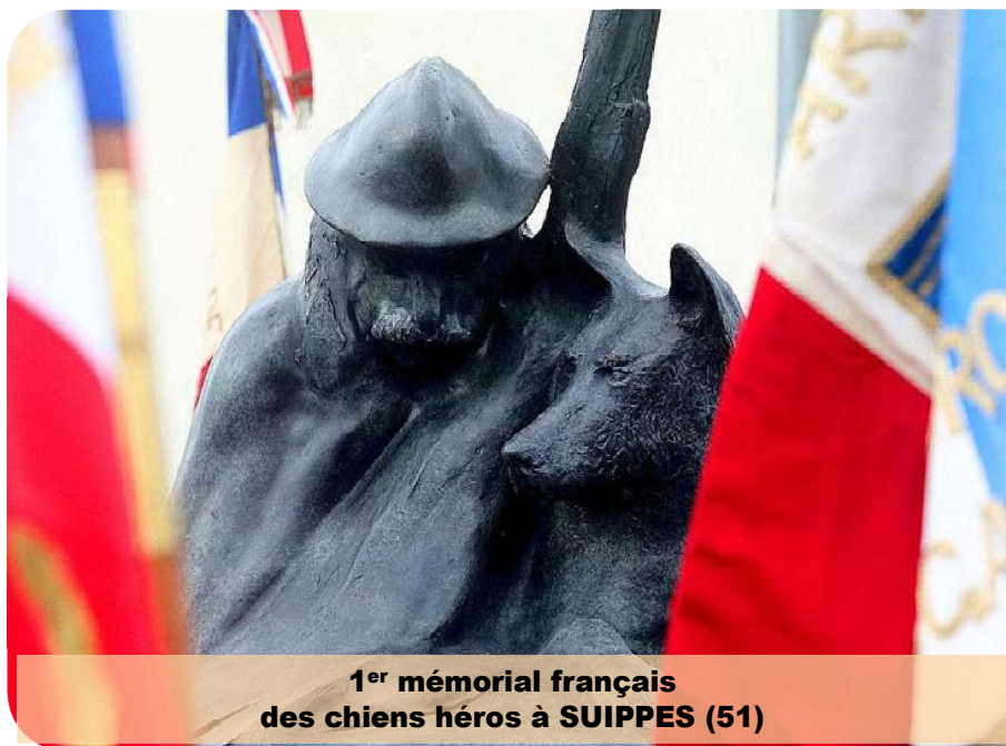
1 er mémorial français des chiens héros à SUIPPES (51)

CLOTURES DES ENGAGEMENTS: 21 MAI ET 6 JUIN 2023 (7/06 sur internet)