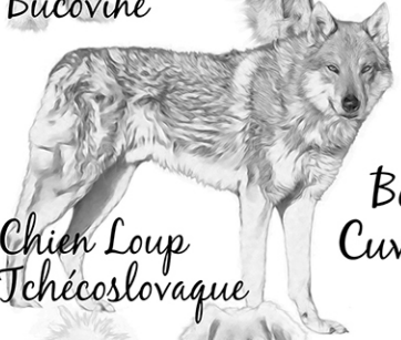
Chien Loup Tchecoslovaque