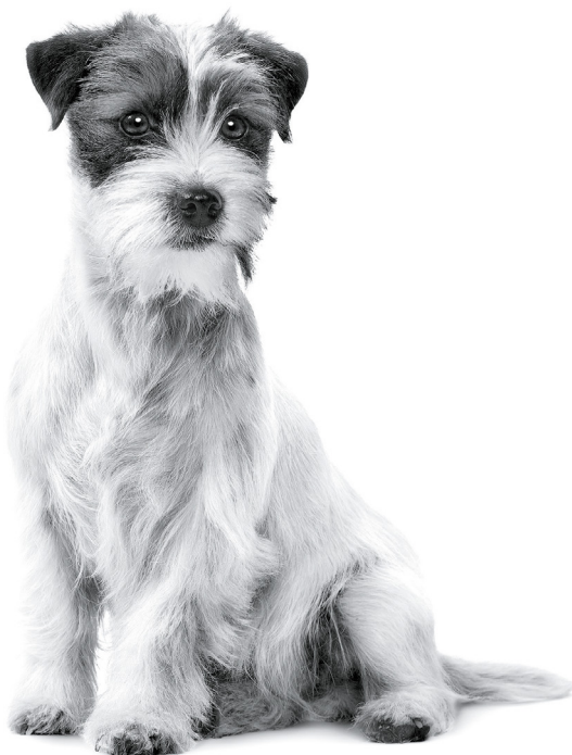
Jack Russell Terrier adulte

Pour plus d'informations, rendez-vous sur www.royalcanin.com ou prenez contact avec votre commercial Royal Canin .