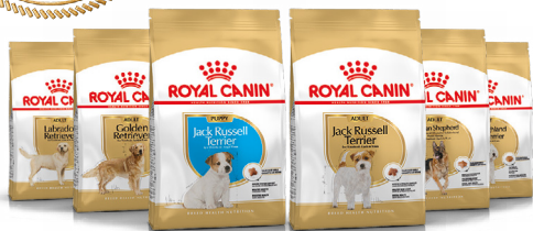
Jack Russell Terrier chiot