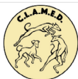
Club des lévriers d'Afrique et de la Méditerranée