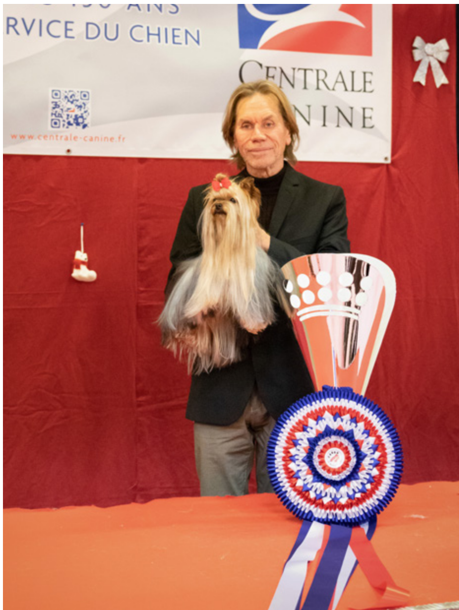
BIS CACS Rouen 2022