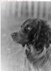
Races non reconnues par la FCI