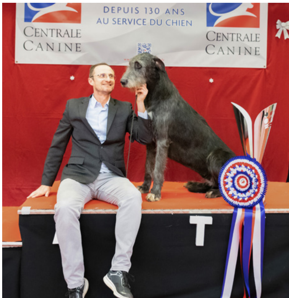
BIS CACIB Rouen 2022