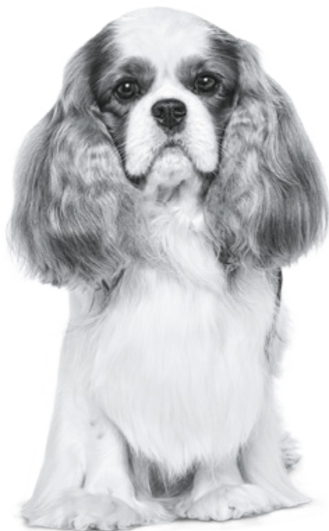
Cavalier King Charles adulte

Pour plus d'informations, rendez-vous sur www.royalcanin.com ou prenez contact avec votre commercial Royal Canin .