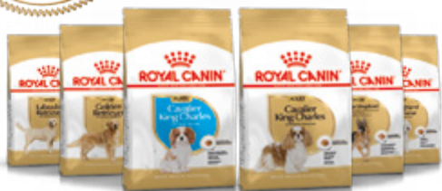
Cavalier King Charles chiot