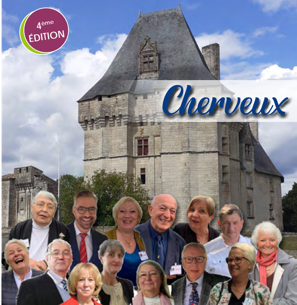
Le Jury au Château de Cherveux