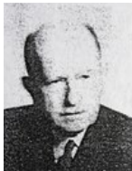
Comte de CATALAN de 1937 à 1973