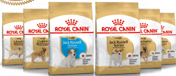
Jack Russell Terrier chiot