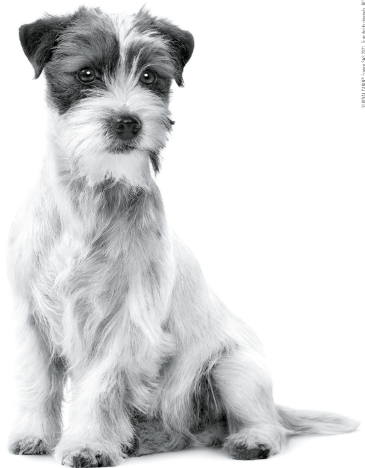
Jack Russell Terrier adulte

Pour plus d'informations, rendez-vous sur www.royalcanin.com ou prenez contact avec votre commercial Royal Canin .